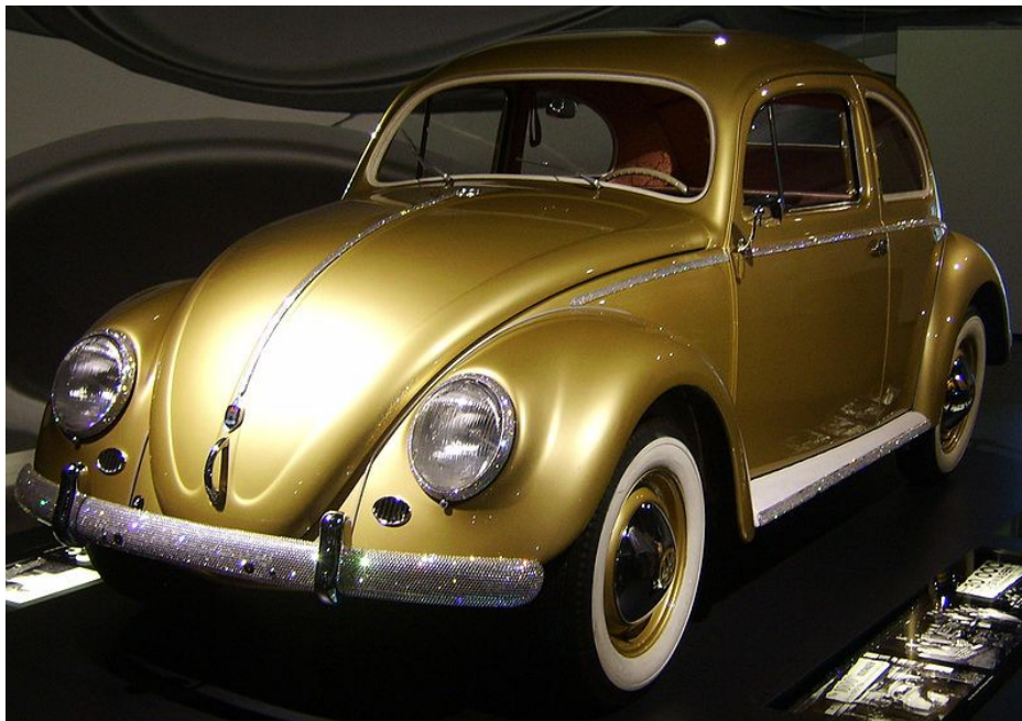
Abbildung 2: Der einmillionste Käfer. Er rollte 1955 als vergoldetes Sondermodell vom Band.

Mit dem wirtschaftlichen Aufschwung entstehen auch zahlreiche neue Unternehmen, die durch ihre Produkte schnell zu Weltruhm gelangen. Insbesondere der Elektrobereich boomt: Waschmaschinen, Kühlschränke oder Fernsehapparate sind ebensolche Verkaufsschlager wie Maschinen und Motoren, Industrieanlagen oder Automobile. Durch den schwachen Dollar blüht der Außenhandel, der Slogan „Made in Germany“ wird zum Qualitätssiegel für Exportgüter. Deutschland mausert sich zum Exportweltmeister. So rollt im Werk Wolfsburg bereits 1955 der millionste VW Käfer als vergoldetes Sondermodell vom Band. Er wird in den Siebzigern mit Filmen wie „Herbie“ zum Leinwandhelden. 2003 wird schließlich die Produktion eingestellt. Jedoch genießt er bis heute Kultstatus und gilt als das Symbol des Wirtschaftswunders.